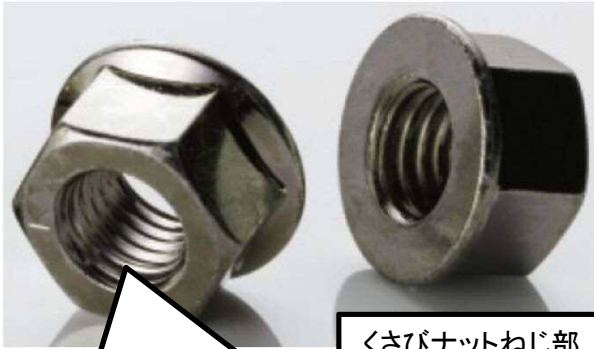
くさびナットねじ部