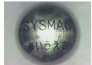
SUS 303 φ19 球体 黒色印字