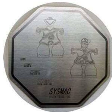
SUS 304 ミガキ ロゴマークの黒色印字