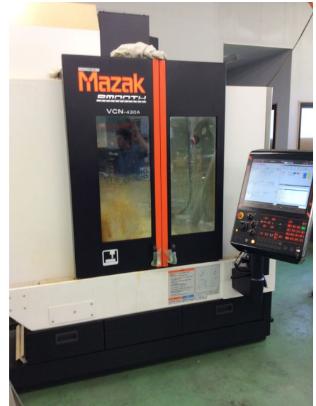
3軸マシニングセンタ