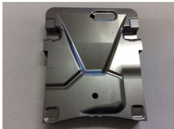
複雑形状部用に加工した 製品ウケ部品