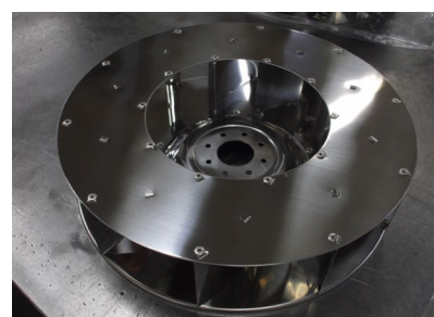
SUS2B材から研磨材まで全ての加工においての品質を大切にしています。