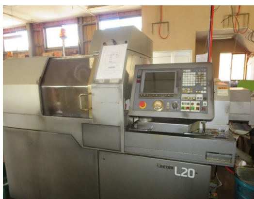
主軸台移動形CNC自動旋盤

アーム アウトサートナット インサートナット ウェイト 押釦 オリフィス ガイド カシメピン カム カムローラー カテーテル カバー ギアブランク キャッチ キャラクター ケース コア 小ネジ コンタクト 軸 シャッターピン 支柱 シャフト ジョイント シリンダ スタッド ストッパー スペーサー スライド スリーブ セットビス 絶縁座 潜望鏡 ターミナル 端子 タンポ チップ ツマミ テーパーピン 鉄芯 電極 止メネジ ナット ニップル ノズル パイプ ハンマー ビス ピストン ピン プーリー ブッシュ プラグ フランジ 噴口 ホルダー ボディー ポペット モール ライナーヌキ リベット リング レバー ローラー ロール ワイヤー止メ