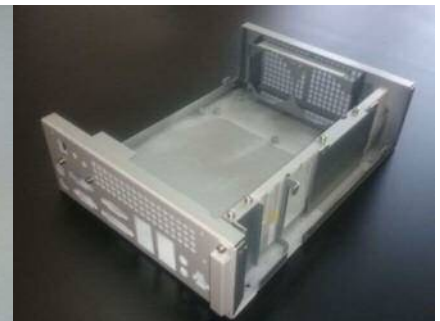
設計～塗装～組立まで、精密板金