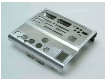
複雑な穴加工の操作盤