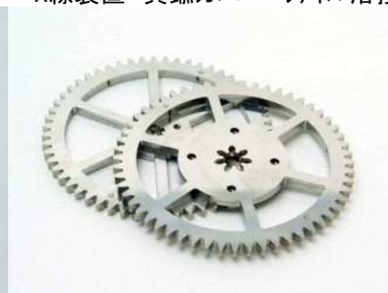
積層板金、レーザ切断による歯車