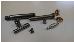
1工程で完成した部品群(左:油圧機器関連部品、右:工作機械関連部品)

鋼材(調質材も含む)、ステンレス(SUS304、SUS316L、他)、アルミ(5000番、6000番代、他)、銅(純銅、真鍮、砲金、他)、樹脂(ジュラコン、MCナイロン)、64チタン