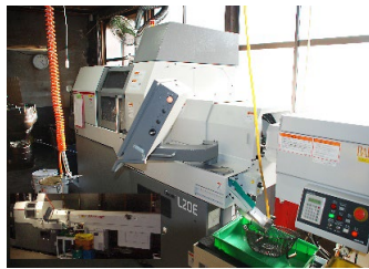
図1.CNC自動旋盤Cincom L20E 9型 (Φ3～Φ20の外径サイズを旋盤・複合加工)(Φ20～65の外径サイズを旋盤・複合加工)