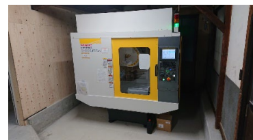
FANUC製高精度切削加工機 ロボドリルα-D21LiB 5ADV 切削加工範囲の拡大