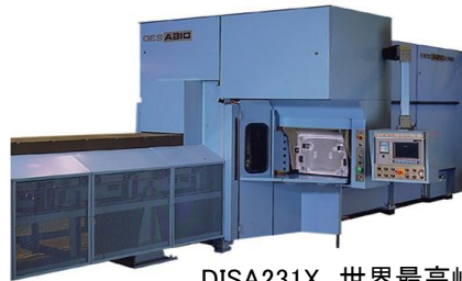
DISA231X 世界最高峰・最高速水準の無枠高速造型機

MAGMA解析により硬度、引張強度と言った機械的性質を得ることが可能、また形状による最弱部、鑄造欠陥等が予想できるので形状、材質等の提案も可能