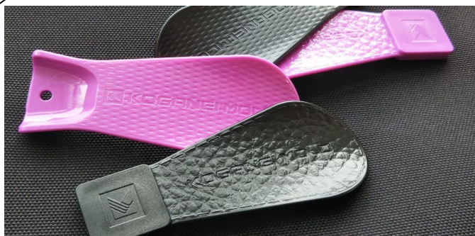
「デジタルシボ」を施した当社のオリジナル「シューホーン」

「デジタルシボ」開発用に有機的なデザインが得意な「仮想クレイモデラー」を導入し、機械系CADとの融合を図る