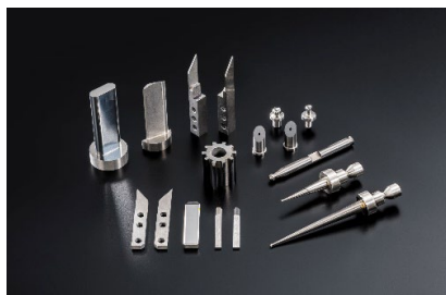
電子部品、産業用機器部品、測定端子類