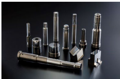
冷間鍛造金型パンチ類