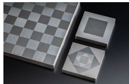
展示用に作りました 2μm段差の市松模様