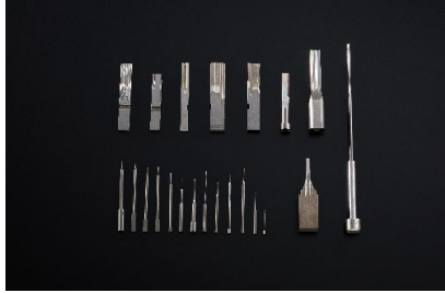
順送金型用パンチ