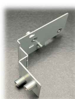
ネジ切り・打ち込み