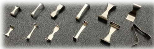
材質提案・形状提案・工法提案