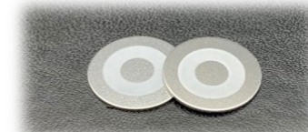
研磨・めっき・印刷