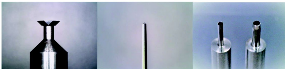
PCDカッター 先端PCDろう付