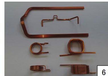
1.圧縮バネ線径φ0.1~φ2.0 研磨0.5以上 2.引張バネ線径φ0.3~φ1.2