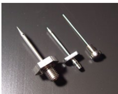
インクジェットプリンター用 ノズル