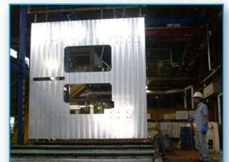
めっき・表面処理