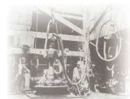
◀明治中期の石油掘削▶

柏崎市は日本初の本格的石油精製の地であり、ここから派生した機械部品製造などを中心とした「ものづくり」は100年の歴史を誇ります。