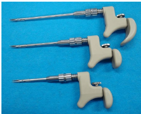
■伊那中央病院と共同開発