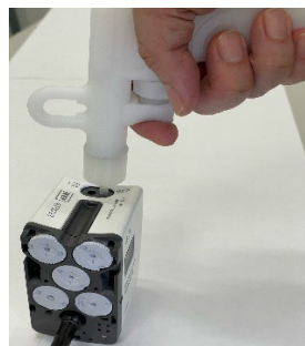
手術支援ロボットのインストゥルメントや耳鼻科吸引管の洗浄ノズルを新発売!!