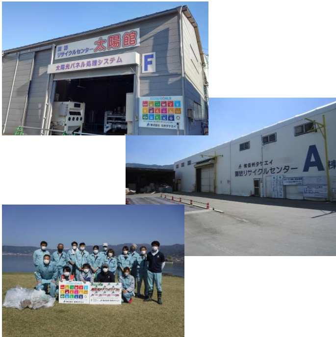
太陽光パネルリサイクルの流れ

施設は①油圧式フレーム外し機、②手動式カバーガラス剥離装置、③ガラスふるい機の3つの機械で構成されます。