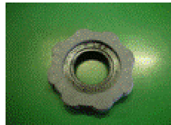
②ガスポンベハンドル