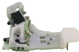
POM材+金属インサート +スイッチ抵抗溶接