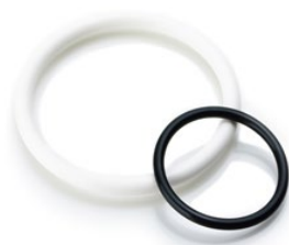
超高性能フッ素ゴム製品