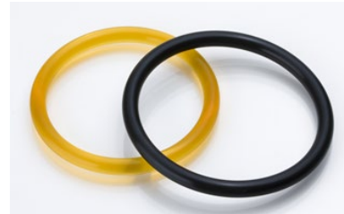
半導体製造装置向け高機能Oリング