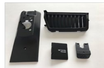
放送局向けカメラ 外装樹脂切削加工品