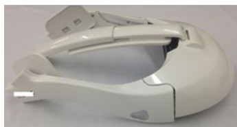
内視鏡手術用 3Dヘッドマウント