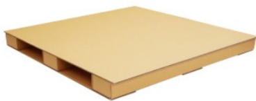
ワンコイン段パレ