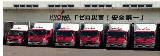
自社物流トラック