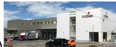
段ボール 衛生工場完備 防虫陽圧機