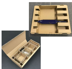
大型精密機機器から小型製品まで