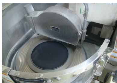
凹面形状の作り込みが可能なロータリー研削盤