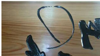
木製看板3Dルーター加工