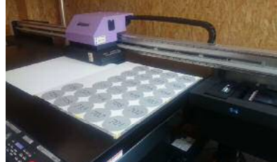
UV硬化インクジェット 素材を選びません(点字加工もOK)