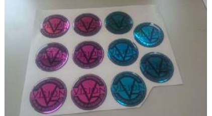
ステッカー(樹脂コーティング)