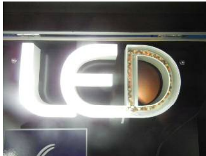
金属文字+LED+3Dアクリル