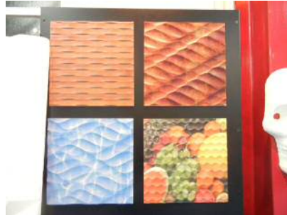
木材ルーター加工+UV印刷