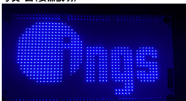
青色チップサイズ0.2x0.38mm 実装ピッチ2.54mm