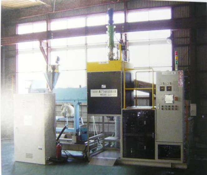
廃棄プラスチック油化還元装置