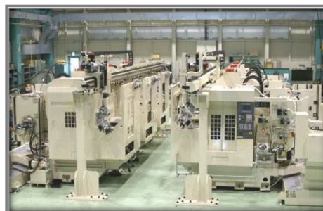
治具セットアップ 加工・デバック