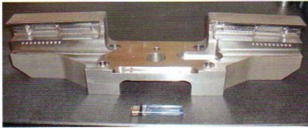
SUS630 140 x 150 x 520