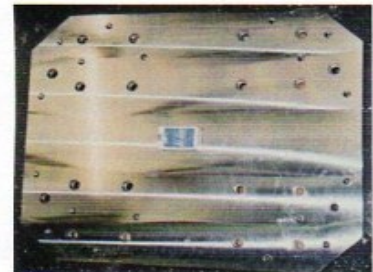
S45C 600 x 800