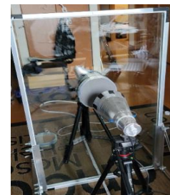
窓ガラスに簡単後付け