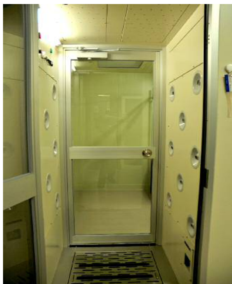
センサー付エアシャワー