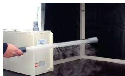
ミストストリーム