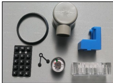
【樹脂、ゴム 切削加工、成形】