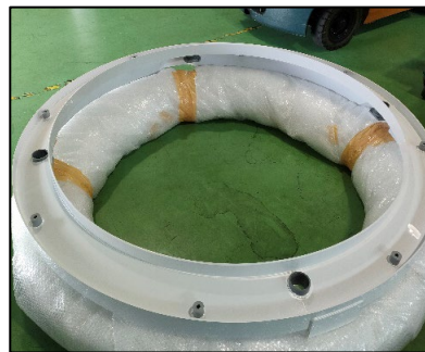
【樹脂 曲げ→接着組立 直径約2000ミリ】